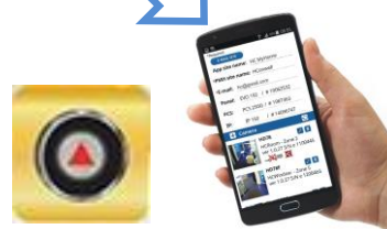
Aplikácia Insite GOLD (Apple, Android)